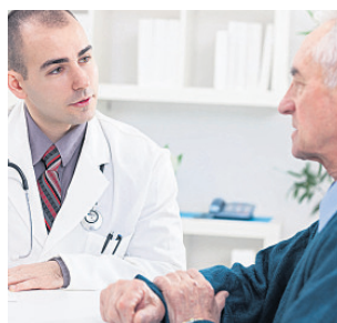
Gerade ältere Menschen, die nicht mehr so mobil sind, benötigen einen Hausarzt in der Nähe

(jd). Auf dem platten Lande werden die Hausärzte knapp. Veleoroten sind bereits Arztpraxen geschlossen worden, weil die Praxishaber in Rente gegangen sind, ohne einen Nachfolger zu haben. Vor allem junge Mediziner finden es wenig attraktiv, sich als Landarzt niederzulassen. Auch in etlichen ländlichen Kommunen des Landkreises Stade ist es um die hausärztliche Versorgung nicht gerade bestens bestellt.