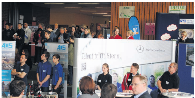
Erste Kontakte knüpfen, Vorträge mitnehmen und sich ausgiebig beraten lassen: Die Ausbildungsmesse im vergangenen Jahr wurde im Schulzentrum Süd in Buxtehude gut besucht

ab. Buxtehude. Schüler, die sich umfassend über Ausbildungen, Jobs, Studiengänge und Auslandsaufenthalte informieren möchten, sind auf der 14. Buxtehuder Ausbildungsmesse von Junge Union und Stadtjugendring genau richtig. Im Schulzentrum Süd bieten am Freitag, 27. Februar, von 9 bis 12.30 Uhr, zahlreiche Unternehmen an ihren Ständen eine umfassende Beratung an. Profis aus Industrie, Handwerk und Handel stehen für Auskünfte und Informationen zur Verfügung - eine ideale Chance für Schulabgänger, alles rund um das Thema Beruf und Zukunft zu erfahren und erste Kontakte zu knüpfen. Manche Messebesucher bringen sogar ihre Bewerbungsmappen mit.