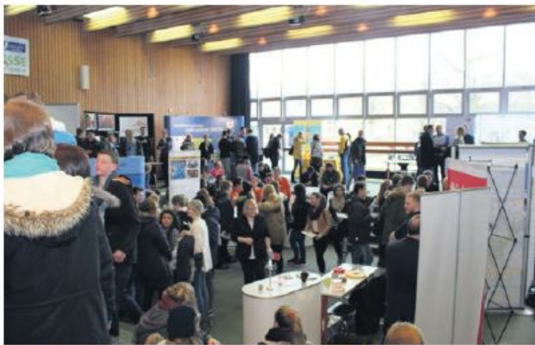
Informationen, Auskünfte und Beratung: Die 14. Buxtehuder Ausbildungsmesse zog viele Schüler und Studenten an

An rund 45 Ständen konnten sich Schüler und Studenten außer über zukünftige Ausbildungsbetriebe auch über Hochschulen und Auslandsaufenthalte schlau machen. Einige der jungen Gäste